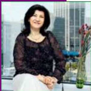
Η κ. Μαργαρίτα Καραβασίλη, τ. Γενική Επιθεωρήτρια Περιβάλλοντος που δικάζεται αυτές τις ημέρες

Αυτές τις μέρες διεξάγεται η δίκη της τ. Γενικής Επιθεωρήτριας Περιβάλλοντος. Την δίκη προκάλεσε ο διάδοχός της στην Υπηρεσία κ. Δερμιτζάκης, για συκοφαντική δυσφήμιση, επειδή η κ. Καραβασίλη δήλωσε σε συνεντεύξεις της ότι μετά την εκδίωξή της από την Υπηρεσία, οι έλεγχοι στον Ασωπό ατόνησαν.